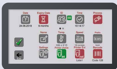
Benutzerfreundliche und intuitive Anwendungen (AppCtrl)