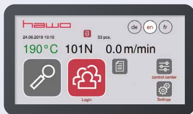
Selbst konfigurierbare Startseite